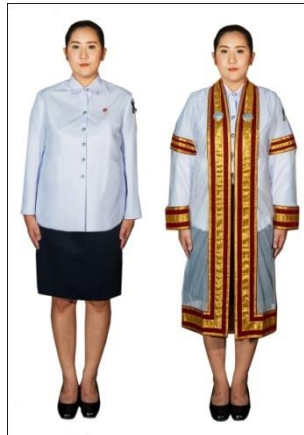
การแต่งกายของบัณฑิตหญิงมีครุภัณฑ์