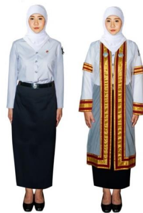
การแต่งกายของบัณฑิตหญิงมุสลิม

อนึ่ง ครุยปริญญาและเข็มวิทยฐานะ เป็นสิ่งมงคลสูงสุดซึ่งได้รับพระราชทาน จึงห้ามสวมพวงมาลัยติดดอกไม้ เครื่องประดับอื่นใดที่ครุยปริญญาหรือบนศีรษะ