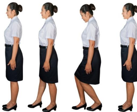
ขั้นตอนวิธีการถอนสายบัว

- ยืนตัวตรงเท้าชิดกัน แขนและมือปล่อยลงแนบลำตัวตามสบาย ชักเท้าข้างใดข้างหนึ่ง ตามถนัดไปด้านหลัง ไขว้ขาให้เข้าซ้อนกัน ปล่อยมือทั้งสองไว้ข้างลำตัว ขณะที่ไขว้ขามาด้านหลังให้ทิ้งน้ำหนัก ย่อตัวลงตรง ๆ พรอมกับสายตา หลบต่ำ จากนั้นยืดตัวขึ้น ลากขาที่ไขว้กลับมาชิดกัน และยืนตรงตามเดิม